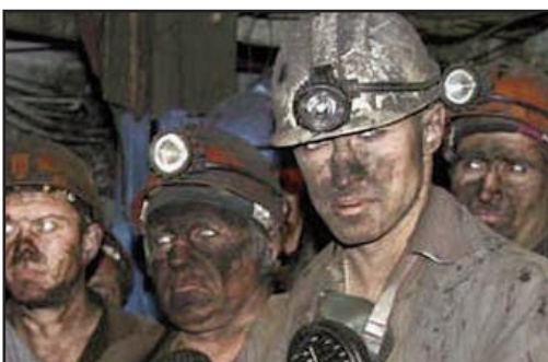
«МВФ, вон из Европы! Не соглашайтесь с этими договоренностями!»

КК: Румыния, вступив в ЕС в 2007 году, без согласия румынского народа, но с одобрения находившихся у власти холюев, по факту признала свой статус американской колонии и тех, кто диктует ей из Брюсселя. Доказательства? Более 7,4 миллиона голосов были аннулированы, как следствие, в целях сохранения их интересов политико-экономического угнетения в